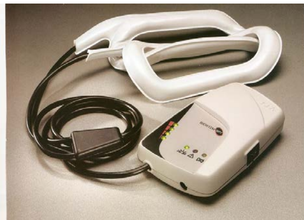
Efficacy documented in 20.000 treated cases

La señal FOS (Focused Osteogenetic Signal) Focalizada ha demostrado después de 20 años de experiencia y más de 100.000 casos tratados, su eficacia en el tratamiento de múltiples patologías óseas y ortopédicas.